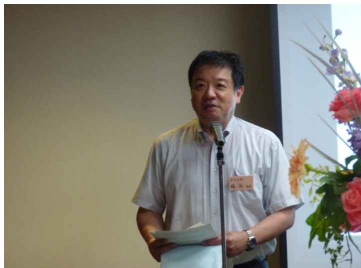
越谷先生がお出で下さり、大学の近況などについて説明してくださいました。