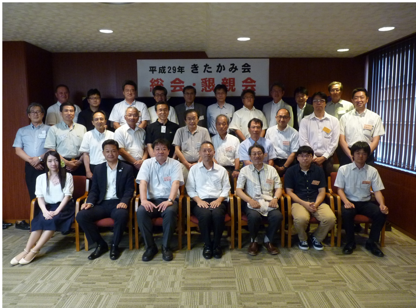
他会支部及び盛岡市東京事務所長もお出で下さり、楽しい会になりました。